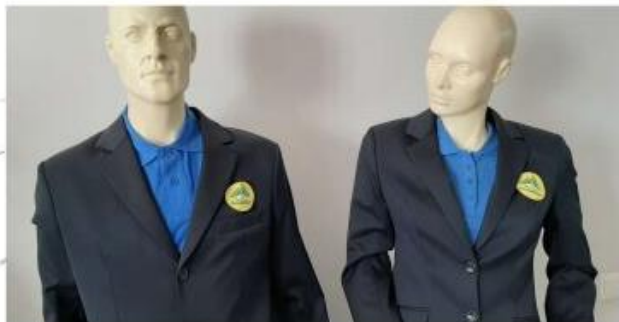
Vyresnių klasių mokslėivių uniforma. Mėlynos spalvos švarkeliai su emblema.