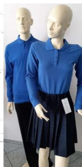
Polo marškinėliai trumpomis ir ilgomis rankovėmis, mėlyna spalva

Vyresnių klasių mokiniams siūlome prie turimos uniformos įsigyti mokyklos emblemą ir polo marškinėlius.